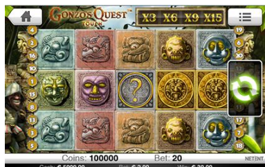
Il simbolo Wild sostituisce qualsiasi altro simbolo