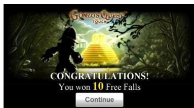
Presentazione della vincita delle Free Fall

Non ci sono limiti al numero di Avalanche che il giocatore può ottenere durante un round di gioco, tuttavia il moltiplicatore massimo è 5 nel gioco principale e 15 nella giocata Free Fall.