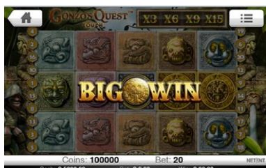
Presentazione di una grande vincita