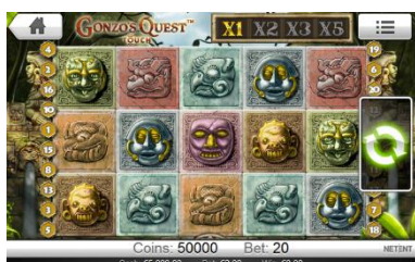
Area del gioco principale