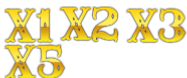
Moltiplicatori Avalanche nel gioco principale