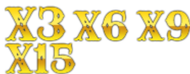
Moltiplicatori Avalanche nei Free Spins