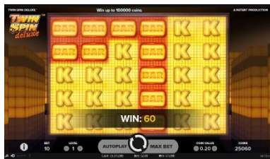
Función Cluster Pays™