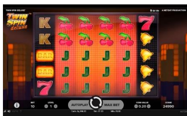
Función de Rodillo doble

Varios grupos del mismo símbolo que no sean adyacentes cuentan como grupos separados y pagan por separado.