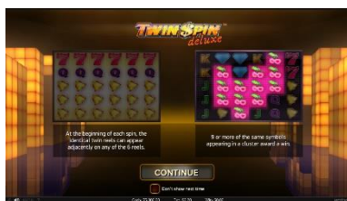
Pantalla de introducción