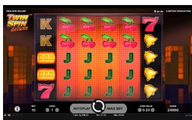
Funkce Twin Reels

Shluky shodných symbolů, které spolu navzájem nesousedí, se považují za samostatné a proplácají se samostatně.