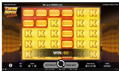
Funkce Cluster Pays™