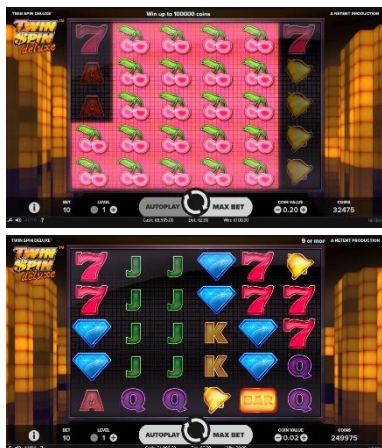
Grafické zpracování hry Twin Spin DeLuxe™