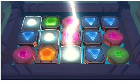
Režim Free Spins