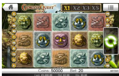
Área del juego principal