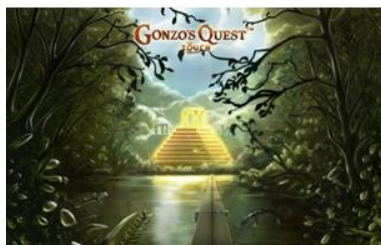
El Dorado de Gonzo