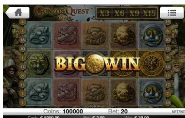
Presentación de Grandes Premios