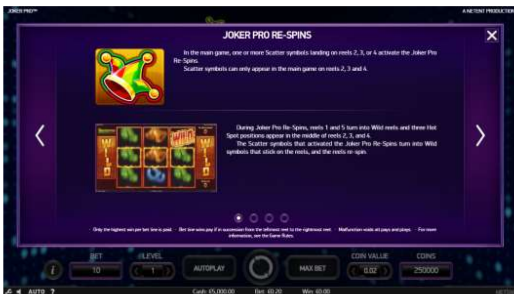
Pagina 1 della Tabella pagamenti