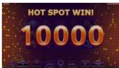
Vincita Hot Spot