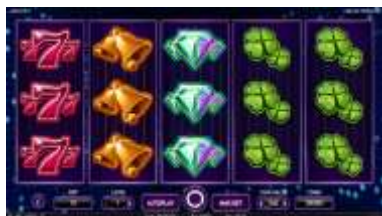
Grafica di Joker Pro™