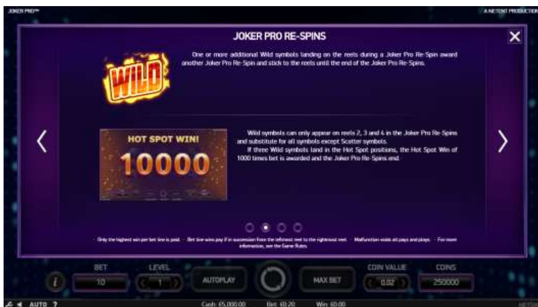
Pagina 2 della Tabella pagamenti