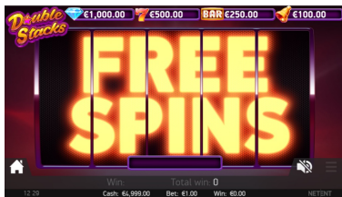
Funcia Free Spins

Pentru cele 4 simboluri cel mai bine plătite, când o rolă este complet umpută cu simboluri de un singur tip, aceste simboluri se vor dubla și vor fi considerate ca două simboluri când se calculează câștigul pentru acea rundă. Aceasta înseamnă că poți obține un câștig de până la 10 simboluri pe orice linie de pariere.