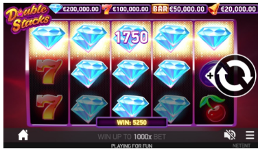
Funcia Double Stacks