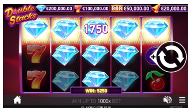
Funkce Double Stacks