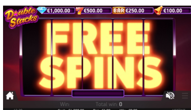
Režim Free Spins

Pro 4 nejhodnotnější symboly platí pravidlo, že pokud některý z nich pokrývá všechny pozice na daném válci, zdvojnásobí se a při vyhodnocování výher z roztočení se všechny jeho výskyty na příslušném válci počítají jako dva symboly. V každé sázkové řadě tak můžete získat výhru až za 10 symbolů.