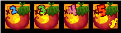
Multiplier Wild 심볼