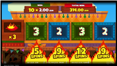
Willy's Hot Wheel

Multiplier Wild 심볼 스택이 확장하여 전체 릴을 가릴 수 있습니다. Multiplier Wild 심볼은 Bonus 심볼을 제외한 모든 심볼을 대체합니다.