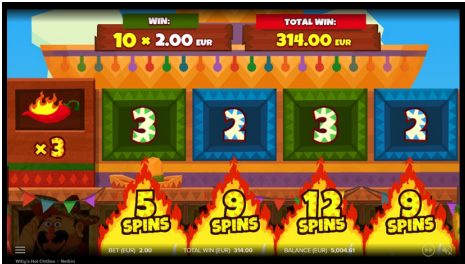
ウィリーのホットホイール

マルチプレイヤーワイルド絵柄のスタックは、リール全体をカバーするために拡張することができます。マルチプレイヤーワイルド絵柄はボーナス絵柄以外の全ての絵柄に代用されます。