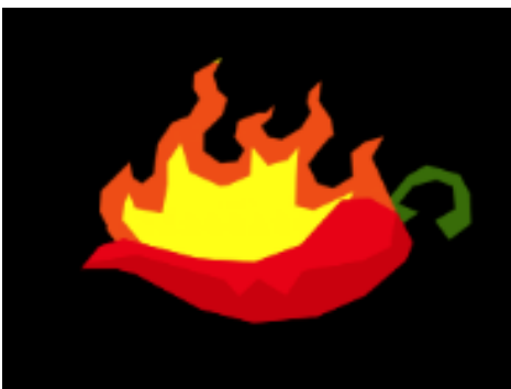
チリマルチプライヤー

リールの1つを、この絵柄に出たファイアーポインターと同じスピン回数のファイアーポインターに変えます。すべてのリールがファイアーポインターの場合、この絵柄にファイアーポインターが出ると、3回分のウィリーのホットホイールが追加されます。