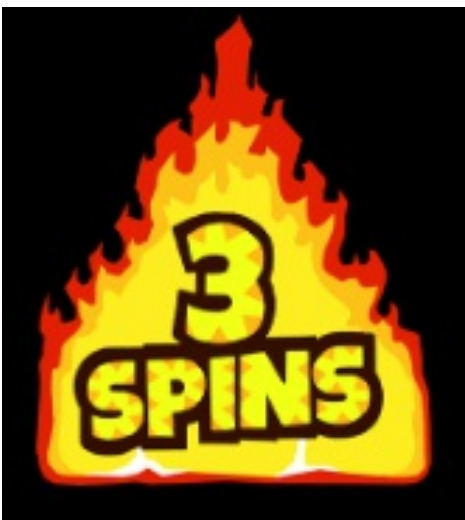
ファイヤーポインター

リール1にボーナス絵柄が出て、同時にリール全体をカバーするマルチプレイヤーワイルド絵柄から成る1つまたは複数のスタックとの組み合わせが出ると、ウィリーのホットホイールフィーチャーがアクティブになります。