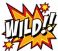
Gewinntabelle Seite 1

Wild symbol substitutes for all symbols except for the Free Spin symbol.