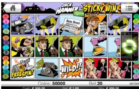
Oblast hlavní hry

Díky funkci Sticky Win™ se vítězné symboly zdržují na obrazovce stejně jako podezřelá osoby postávající na rohu ulice, a to tak dlouho, dokud se objevují nové výhry.