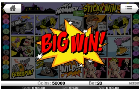
Prezentace vysoké výhry