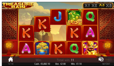
崩塌™ x3 乘数