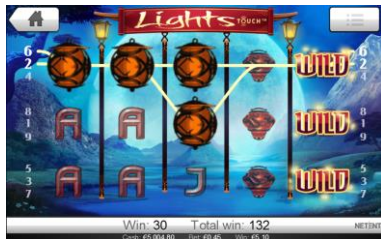
Aún más Comodines se forman durante los Free Spins.