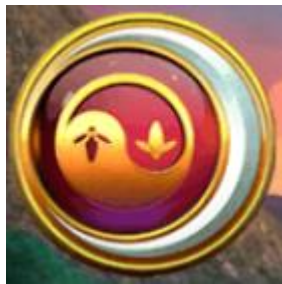
Símbolo de Scatter