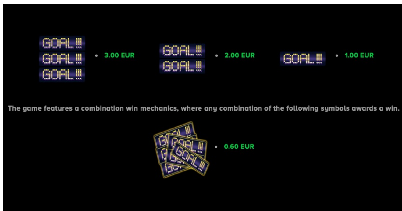
Gewinntabelle Seite 2