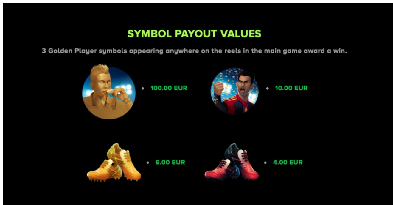
Gewinntabelle Seite 1