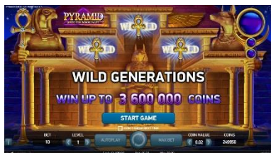
Motiv hry a grafické zpracování