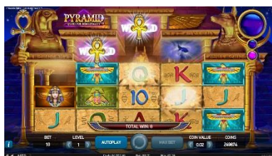
Vytváření symbolů Wild