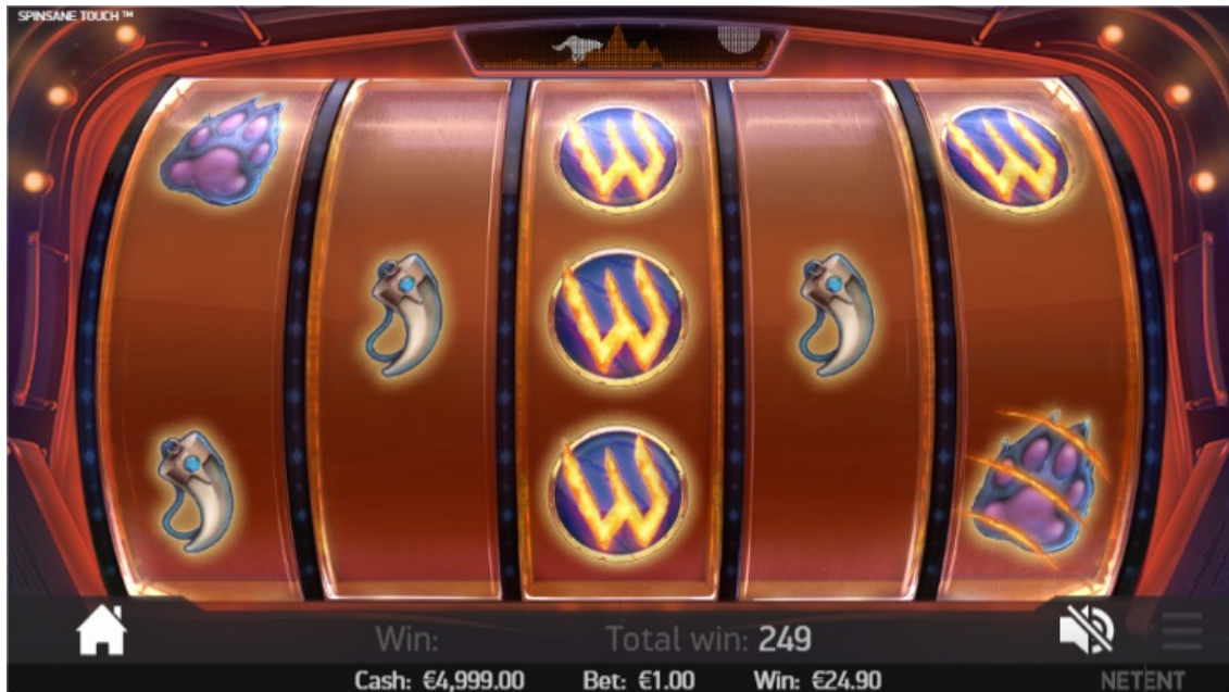
Free Spin con rullo Wild sovrapposto