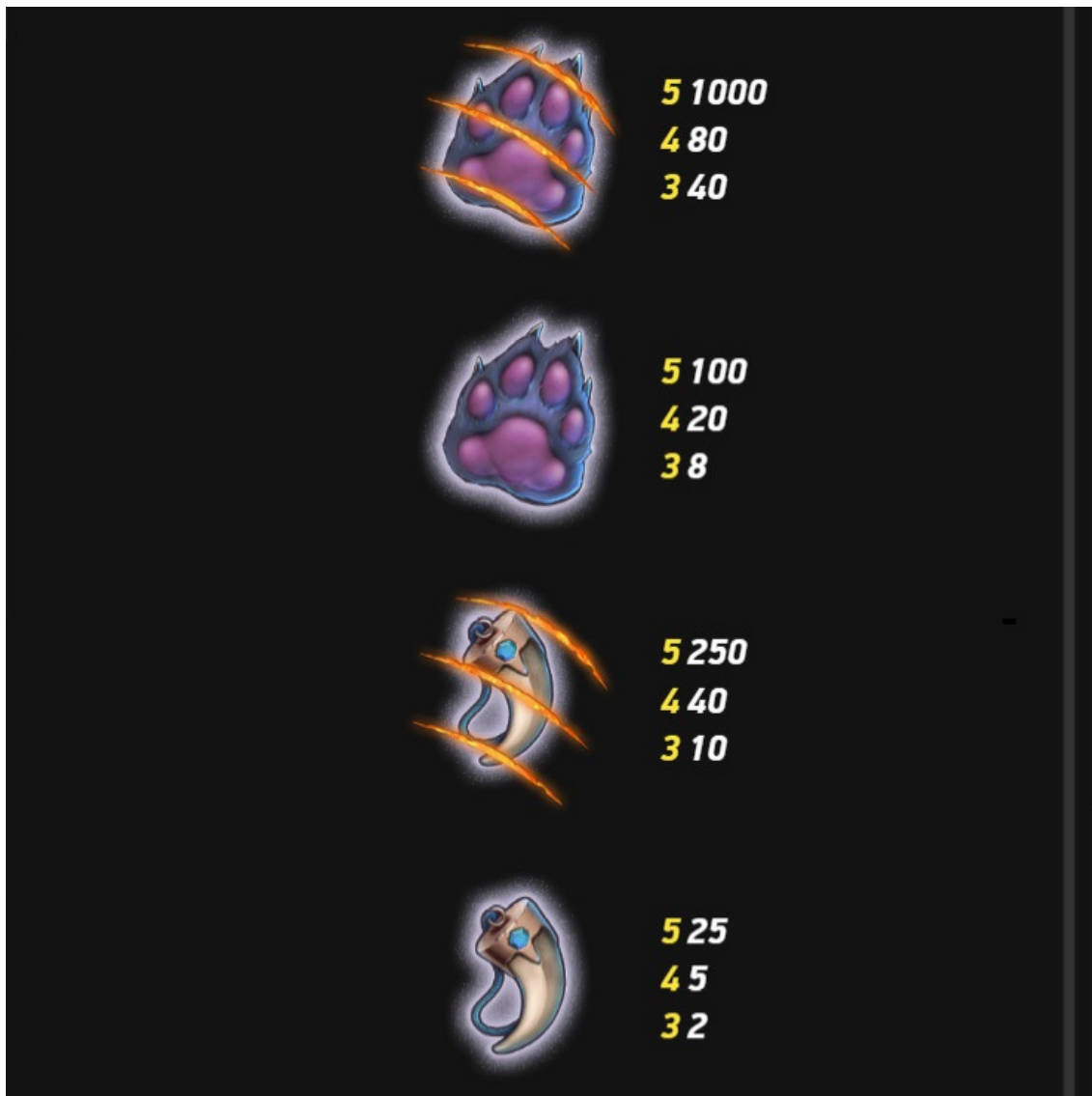
Tabella pagamenti pagina 3