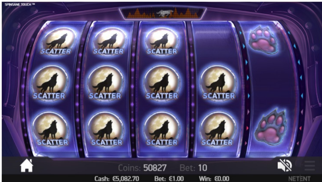
Attivazione dei Free Spin