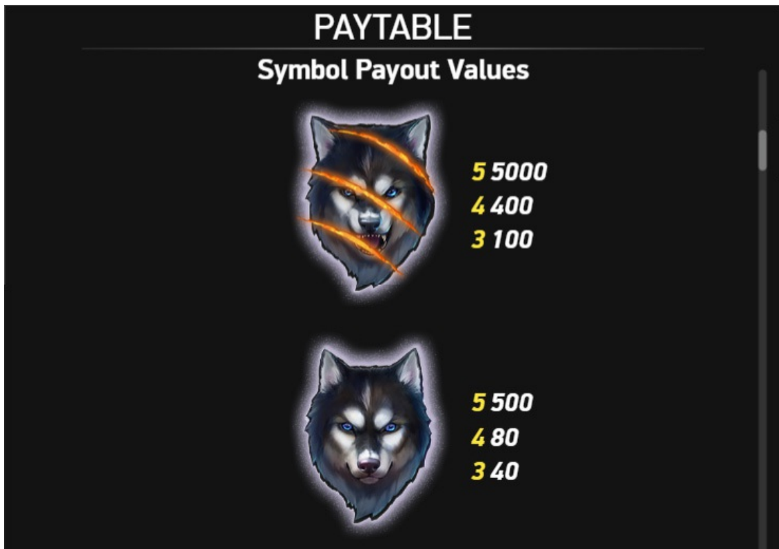
Tabella pagamenti pagina 2