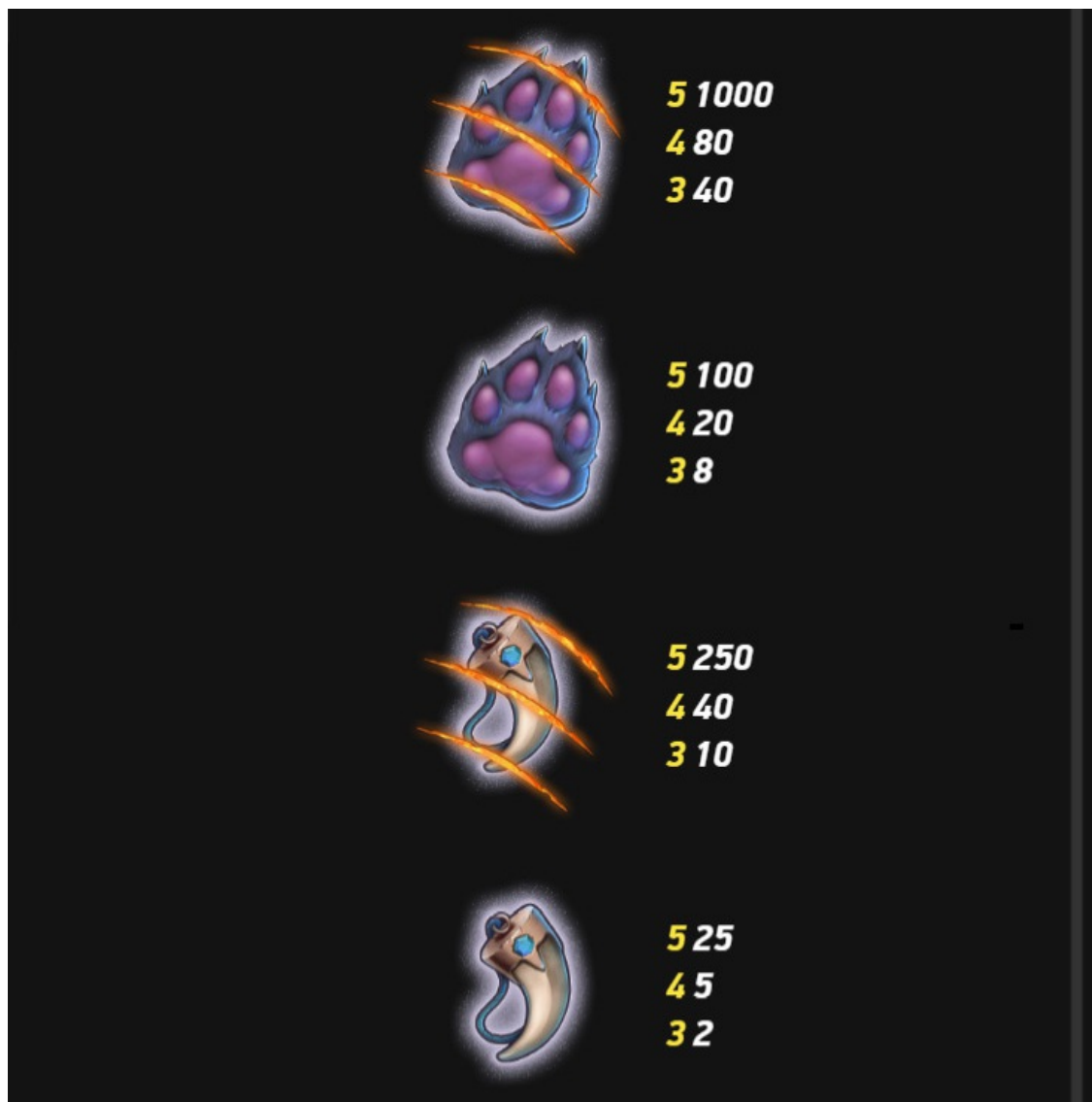
Tabulka výplat 3