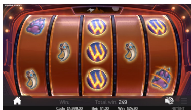
Režim Free Spins s funkcí Overlay Wild Reel