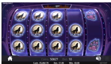
Aktivace režimu Free Spins