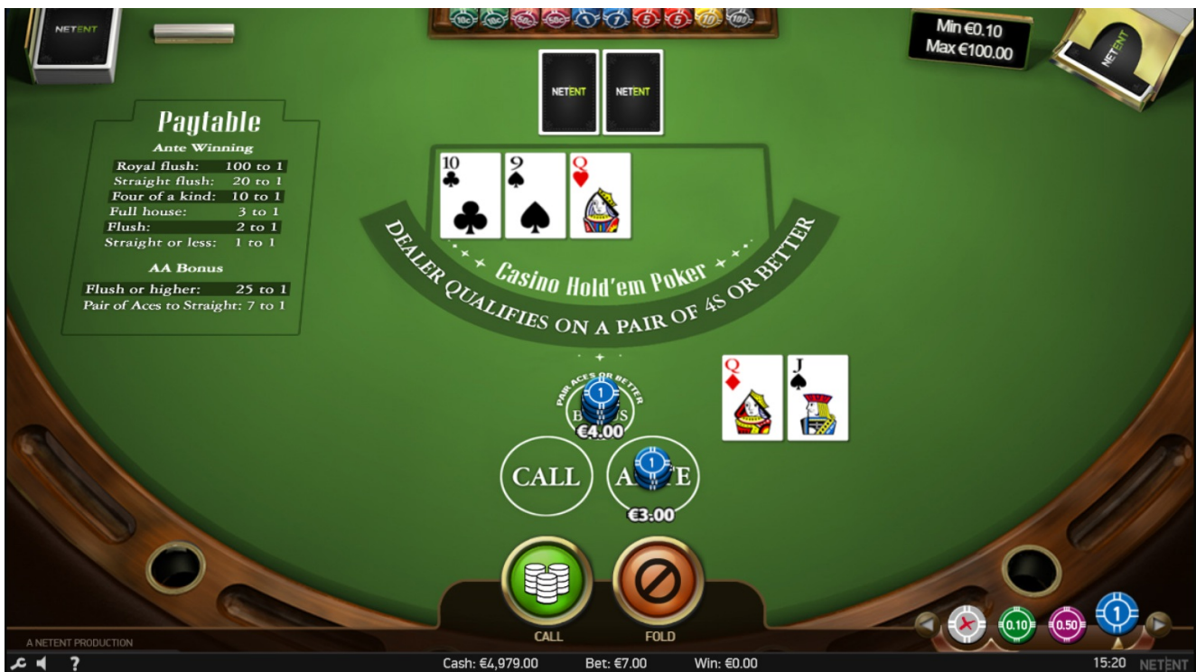
Puntate Bonus AA