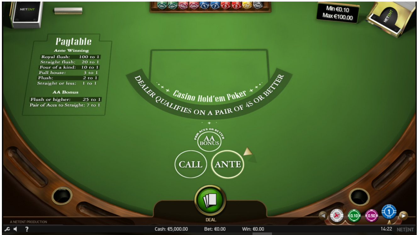
Tema e grafica del gioco