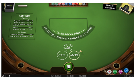
Motiv hry a grafické zpracování