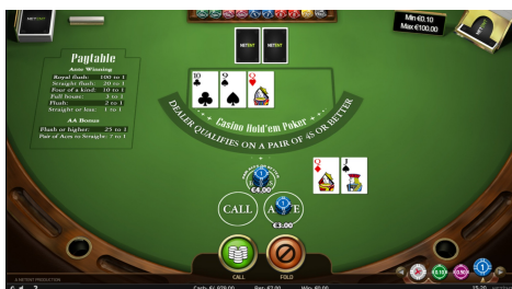
Sázky na AA Bonus