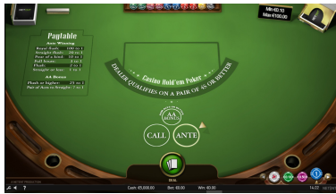
Тема и графика на играта