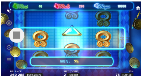
Pfeil nach oben