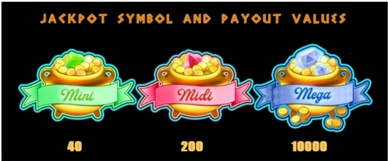
Paytable page 1