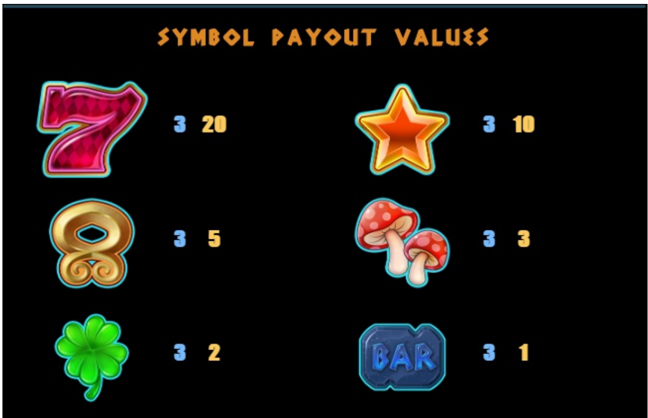
Paytable page 2