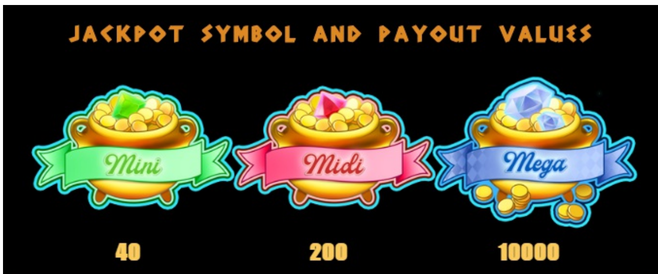
Paytable page 1