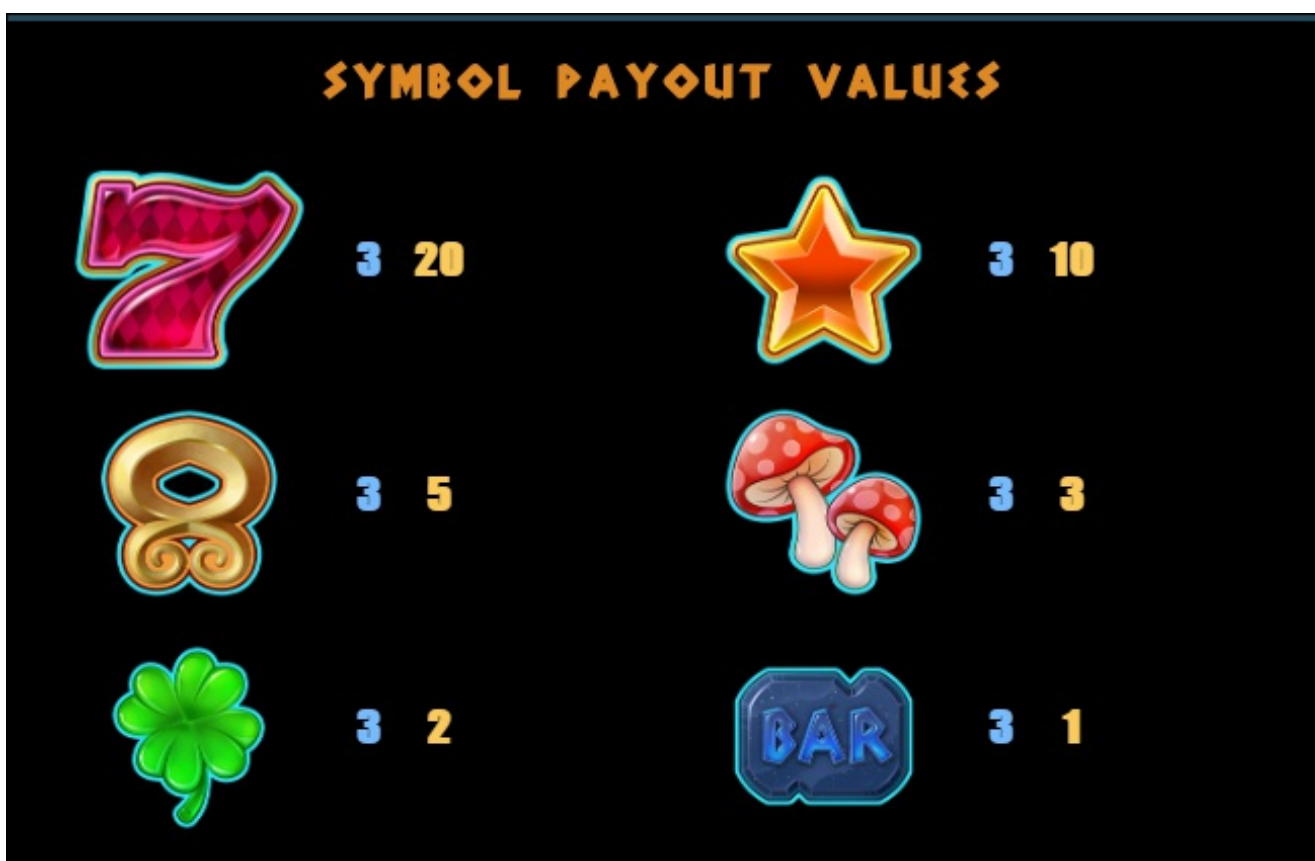
Paytable page 2