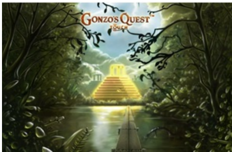
ゴンゾのエルドラド