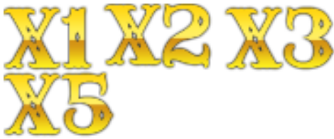
メインゲームのアバランチ マルチプライヤー