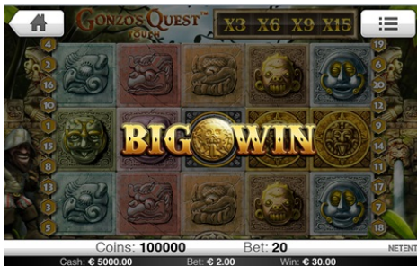
ビッグウィン プレゼンテーション