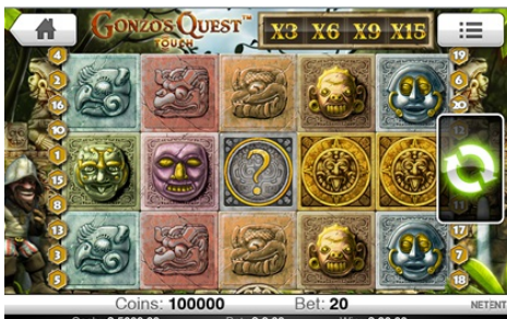
Wild絵柄は任意の絵柄を置き換えます。