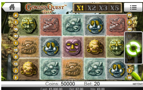
メインゲームエリア