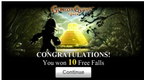
フリーフォール勝利プレゼンテーション