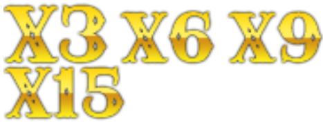
フリースピンのアバランチ マルチプライヤー