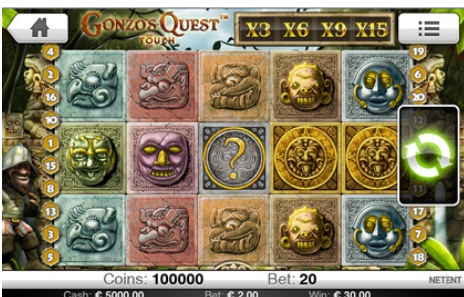
百搭符号可替代任何符号