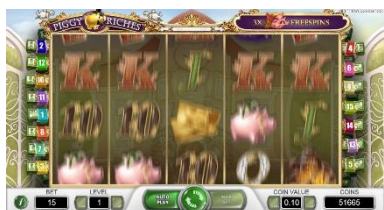
Realistické ztvárnění točení válců