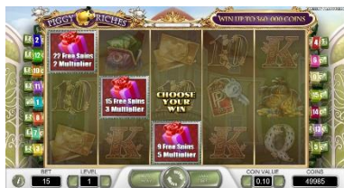
Spuštění režimu Free Spins

Opětovné spuštění režimu Free Spins. Dodatečné symboly Scatter, které se objeví během režimu Free Spins, přidávají jedno další roztočení Free Spin.