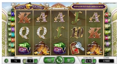
Prvky video automatu