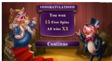
Podrobnosti o režimu Free Spins