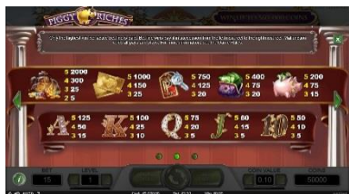
2. strana tabulky výplat