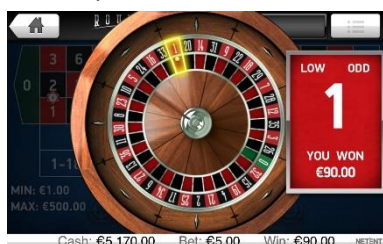
Výsledek herního kola