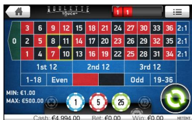
Tavolo di gioco con un'area di puntata selezionata