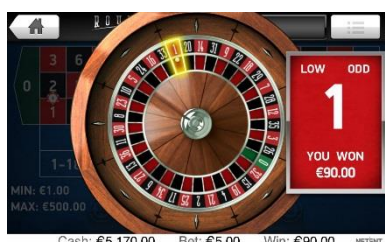
Risultato del round di gioco