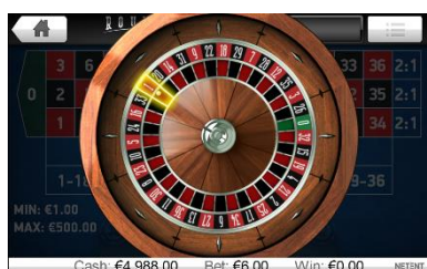
Ruota della roulette