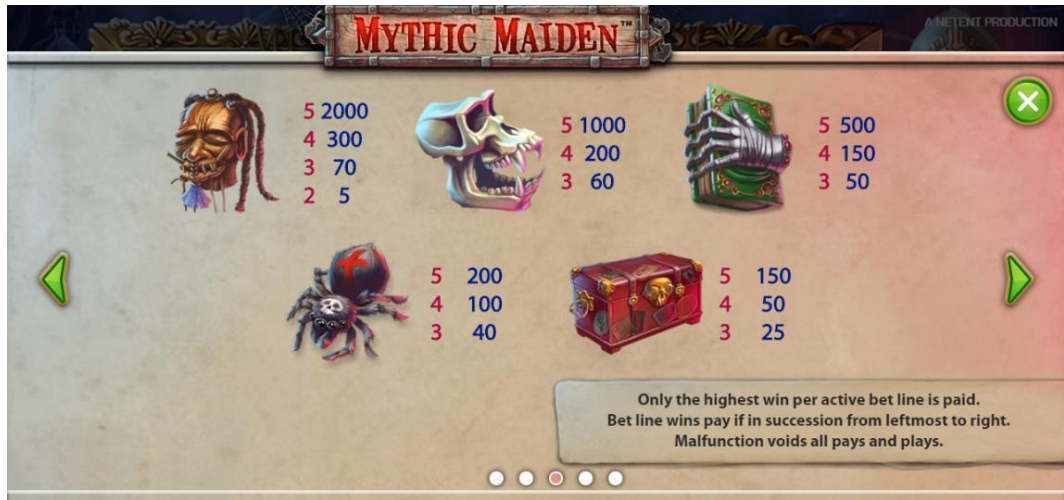
Gewinntabelle Seite 3