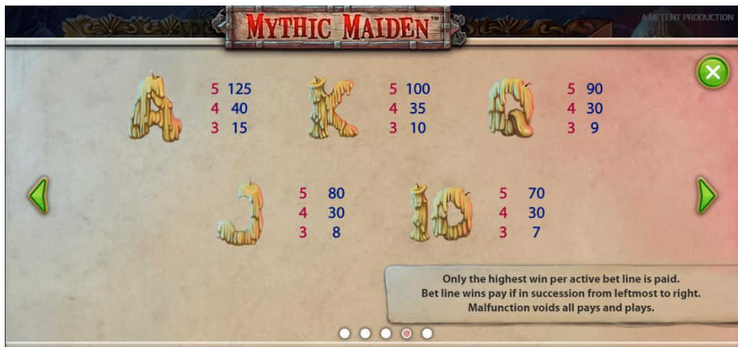
Gewinntabelle Seite 4