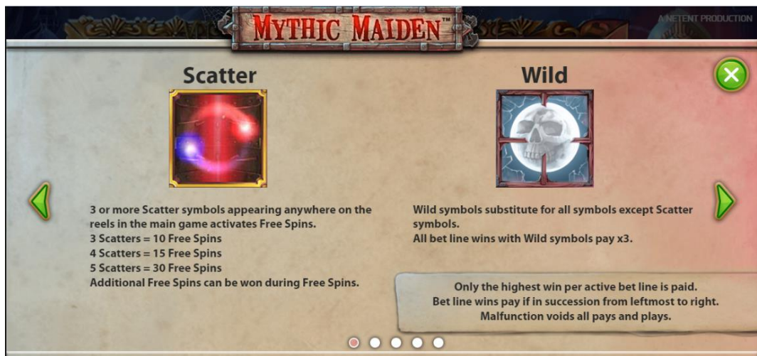
Gewinntabelle Seite 1