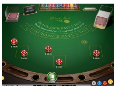
Layout del tavolo