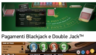
Pagamenti Blackjack e Double Jack™

Le informazioni sullo stato di ogni mano del gioco sono visualizzate sul tavolo, permettendo quindi ai principianti di entrare rapidamente nell'appassionante mondo del blackjack.