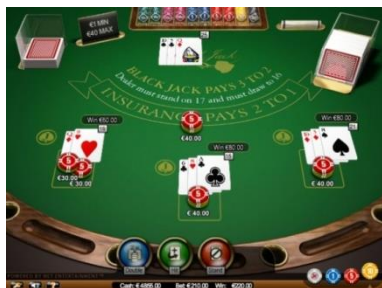
Caratteristiche del gioco nello schermo iniziale