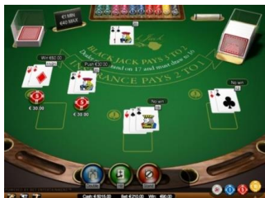
Visualizzazioni delle informazioni sulla mano