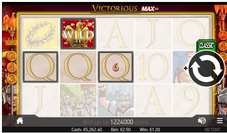
황금 독수리 와일드 대체