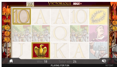
Festeggiamenti per i Free Spins