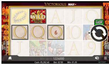
Sostituzione Wild Golden Eagle