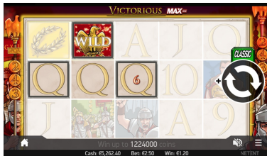
Goldener Adler Wild-Ersetzung