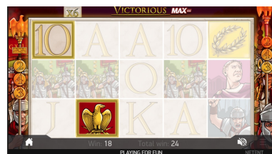
Free Spins feiern