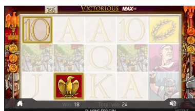
Отпразнуване на Free Spins