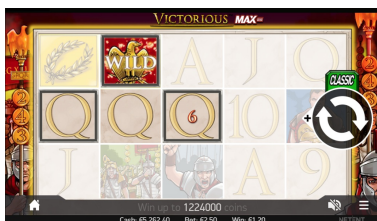
Golden Eagle Wild заместители