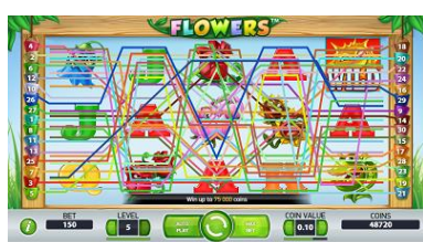
Aktivace všech sázkových řad