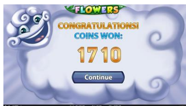
Výhry z režimu Free Spins

Výhry z režimu Free Spins. Po skončení režimu Free Spins se celková výhra připočte k výhrám z kola, ve kterém byl režim Free Spins spuštěn.