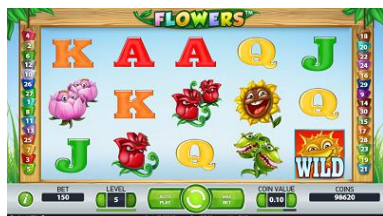
Výhra se symbolem Double

Zábavnost hry Flowers™ zvyšují symboly Stacked Wild, které jsou k dispozici během režimu Free Spins. Symboly Stacked Wild jsou symboly Wild, které se mohou při Free Spins zobrazit náhodně v podobě sad 2 nebo 3 symbolů.