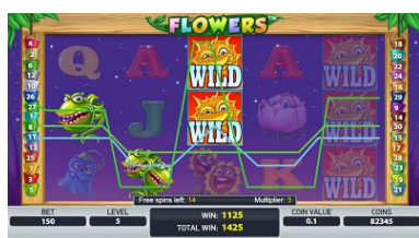
Symboly Stacked Wild v režimu Free Spins