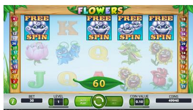
Spuštění režim Free Spins

Jelikož všechny symboly středních výher mohou být zobrazeny jako jednoduché i ve variantě Double, může výherní kombinace v jedné sázkové řadě obsahovat 3–10 shodných symbolů.