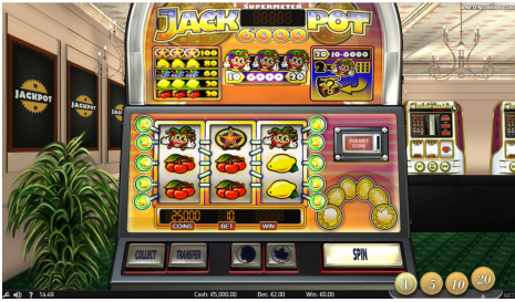
Jackpot 6000 그래픽