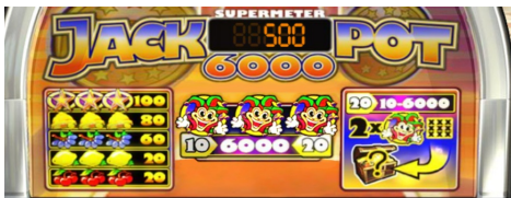
スーパーメーターモード

このゲームには、ダブルアップゲームなどのボーナスフィーチャーと、プレイヤーがランダムにジャックポットを獲得できるスーパーメーターモードがあります。