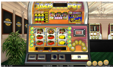
ジャックポット 6000 グラフィックス