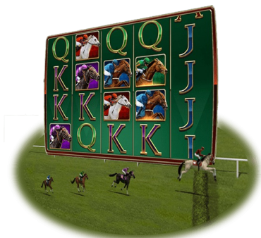
Funkce Peter's Classic Cup

Když se tato funkce aktivuje, na válce se náhodně rozmístí 2 až 5 symbolů podkovy, které změní původní symboly na symboly Wild.