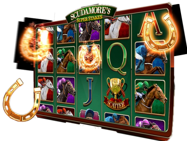
Funkce Random Wild

Objeví-li se v hlavní hře na válcích 1, 3 a 5 celkem 3 symboly Scatter, spustí se funkce Peter's Classic Cup.