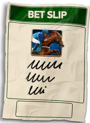
Funkce Bet Slip