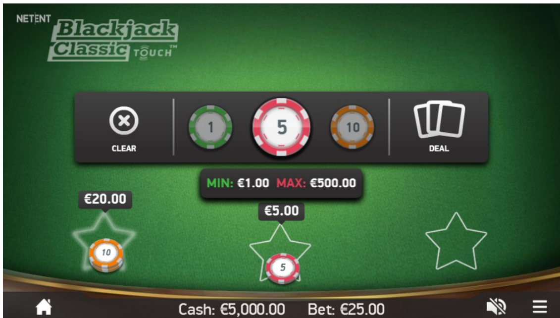
Piazzamento delle puntate