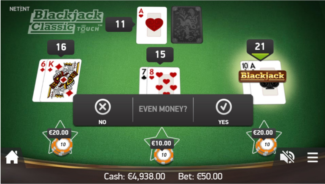
Pagamento alla pari