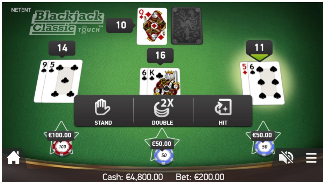
Tema e grafica del gioco